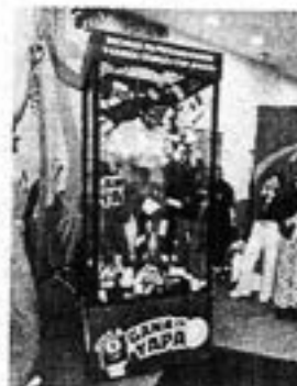
Imagen referencial de la cabina de premios